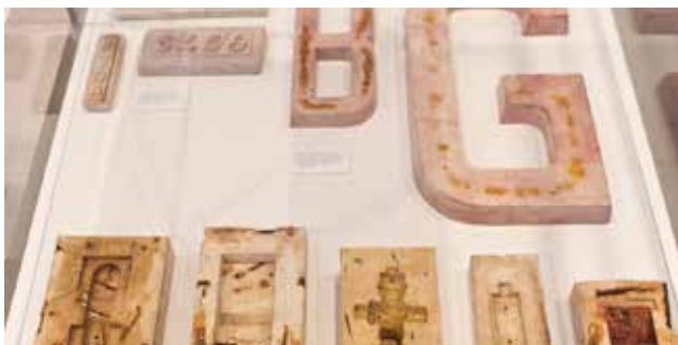
Vista de la exposición Historias de Bombas Gens .

Este itinerario tiene como objetivo hacer participar a los alumnos de una nueva visión sobre el patrimonio industrial. Los mediadores acompañarán a los participantes en una visita dialogada, donde conocerán el funcionamiento de una antigua fábrica de bombas hidráulicas, y cómo determinados factores políticos, económicos, sociales y geográficos influyeron en la evolución de la misma. La actividad incluye la visita a la exposición Historias de Bombas Gens , un recorrido por alguno de los momentos más representativos del edificio, desde su construcción a la actual reconversión en centro de arte. Para finalizar reflexionaremos desde la práctica sobre algunos conceptos comunes a la fábrica y ciertas creaciones artísticas contemporáneas: repetición, serialidad, no autoría, etc., realizando estampaciones con elementos característicos del edificio.