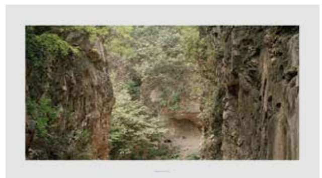
Hombre de Pekín . De la serie Origen , 2005.

SECUNDARIA, BACHILLERATO Y CICLOS FORMATIVOS DE IMAGEN Y SONIDO