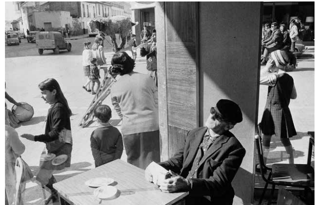
Joel Meyerowitz, Malaga, Spain , 1966.

SECUNDARIA, BACHILLERATO Y CICLOS FORMATIVOS IMAGEN Y SONIDO