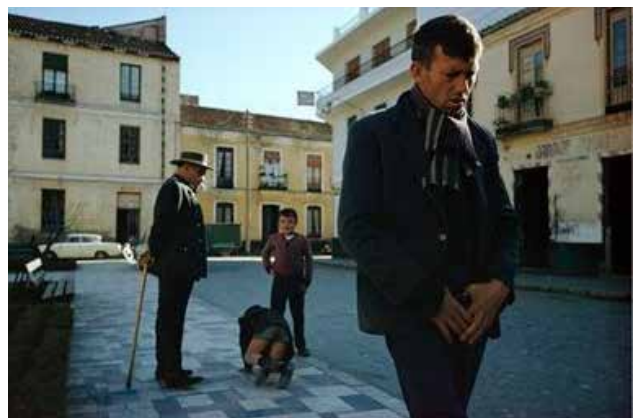
Malaga, Spain , 1967.

Joel Meyerowitz es un fotógrafo especialista en paisajes y retratos urbanos, pionero en el uso del color. La muestra aquí expuesta se centra en su trabajo en España a la década de los sesenta: un corpus inédito que retrata un país en transformación.