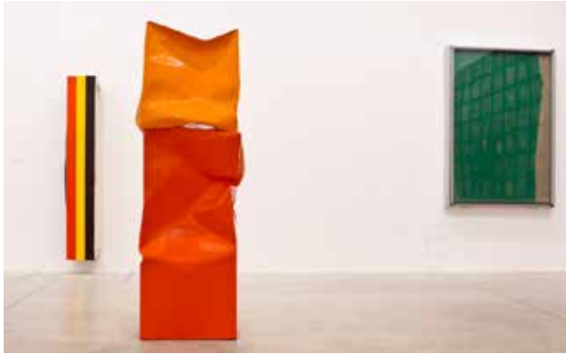
Vista de la exposición ¿Ornamento = delito? en Bombas Gens Centre d'Art.

3ER CURSO DE INFANTIL (5 AÑOS) Y PRIMARIA