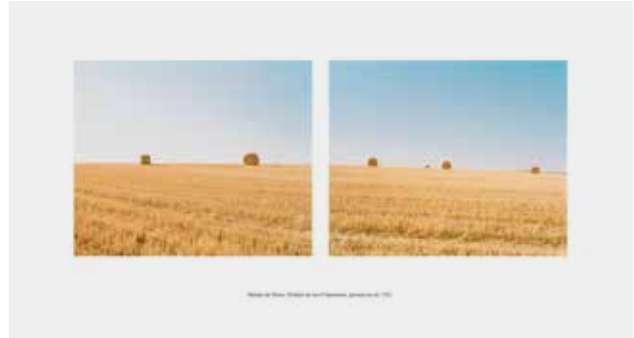
Puente de hierro, Villalar de los Comuneros, primavera de 1525. De la serie Campos de Batalla . España, 1994-1999.