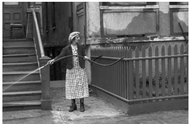
Helen Levitt, New York , c. 1940.

Esta exposición reflexiona, a partir de la obra de diversos artistas, fotógrafos en su mayoría, sobre el modo que habitamos los espacios de la contemporaneidad. Cómo nos relacionamos, ocupamos y usamos las ciudades y sus límites, los espacios de ocio, trabajo o consumo.