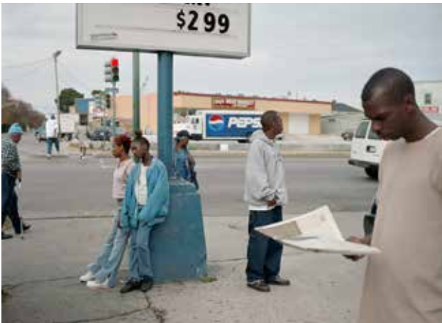
New Orleans. De la serie A Shimmer of Possibility , 2003-2006.

TERCER CICLO PRIMARIA (10 AÑOS), SECUNDARIA, BACHILLERATO Y CICLOS FORMATIVOS DE IMAGEN Y SONIDO