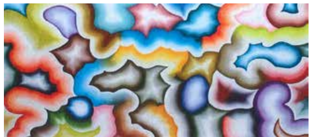
Bernard Frize, Plontois , 2012.

Esta muestra colectiva presenta la obra de diversos artistas que trabajan en la relación fructífera entre lo ornamental y la abstracción desde diferentes aproximaciones y técnicas.