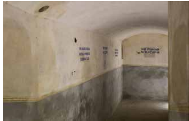
Vista del refugio de la fábrica Bombas Gens.

A PARTIR CICLO MEDIO PRIMARIA (8 AÑOS), SECUNDARIA Y BACHILLERATO