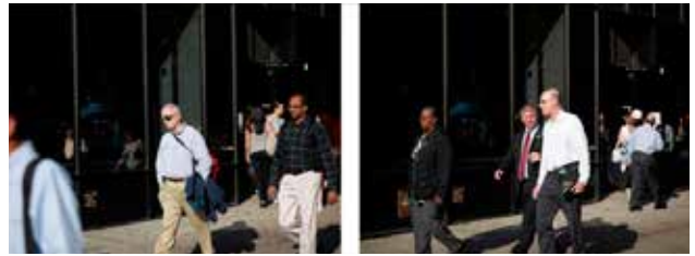
Vesey Street, 25th May 2010, 5.51.05 pm. De la serie The Present , 2010.

Las series fotográficas que aquí se muestran subrayan el interés del artista por analizar la desigualdad racial y social, y reflejar el tejido social contemporáneo a través de imágenes de distintas ciudades estadounidenses.