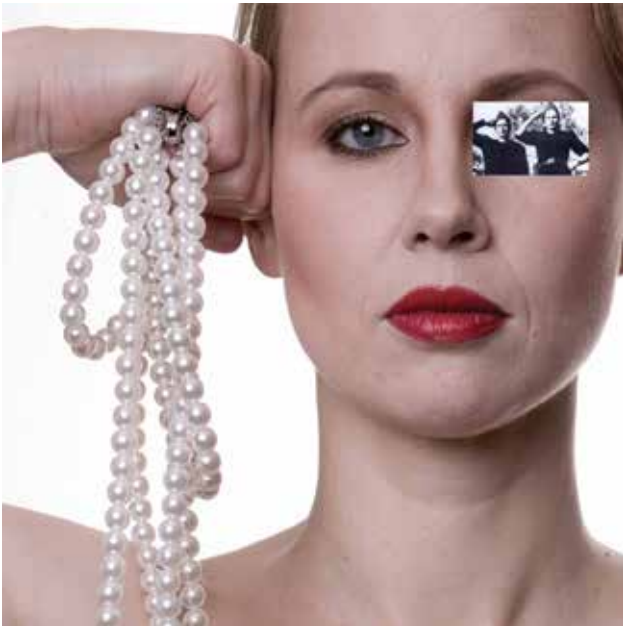
Sanja Ivekovic, The Right One (Pearls of the Revolution) , 2007-2011.

DOS ITINERARIOS: "RECONSTRUYENDO LA CIUDAD" ORIENTADO A PRIMARIA (HASTA 9 AÑOS) Y "PAISAJES HUMANOS" A PARTIR DEL TERCER CICLO DE PRIMARIA (10 AÑOS), SECUNDARIA, BACHILLERATO Y CICLOS FORMATIVOS DE IMAGEN Y SONIDO