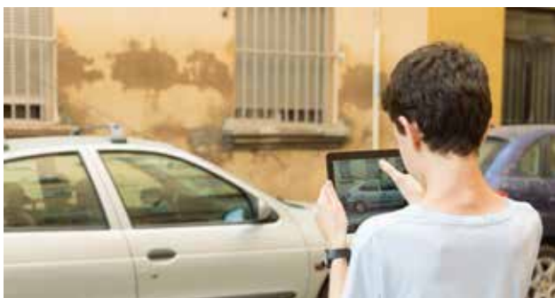
Imagen de taller realizado en Bombas Gens Centre d'Art en julio de 2017.

SECUNDARIA, BACHILLERATO Y CICLOS FORMATIVOS DE IMAGEN Y SONIDO