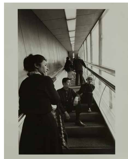
Yutaka Takanashi, Tokyoites , 1965 / 1970-73.

L'exposició és un recorregut per l'art japonés, des dels anys cinquanta del segle passat fins a l'actualitat. La mostra posa l'accent en la fotografia i en els artistes que van participar en la revista, fundada en 1968, Provoke. Provocative Materials for Thought , com ara Yutaka Takanashi o Daido Moriyama, i en referents anteriors com Shomei Tomatsu. La manera experimental en el qual van mostrar les imatges com a producte d'una era marcada per esdeveniments polítics importants, es va convertir en un fenomen i en una tendència que molts altres artistes japonesos van continuar. En l'exposició es mostraran, junt amb els ja esmentats, obres d'artistes com Shigeru Onishi, Akira Sato, Koji Enkoura, Tamiko Nishimura o Noritoshi Hirakawa, entre altres.