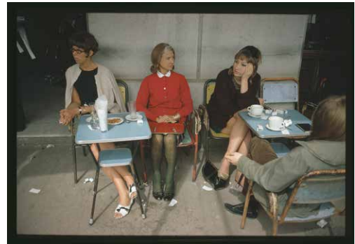
Joel Meyerowitz, Málaga, Spain, 1966.

L'exposició Cap a la llum de Joel Meyerowitz inclou noranta-huit fotografies, quasi totes fetes a Màlaga entre 1966 i 1967, on va conèixer amb els Escalona, una de les famílies flamenques de més renom a la ciutat. L'exposició, centrada en el treball fet a Espanya, té un gran valor, ja que suposa una conversa continuada amb un país en transformació en unes circumstàncies socials, culturals i polítiques difícils, marcades per una dictadura. Meyerowitz és considerat actualment un dels grans representants de la fotografia de carrer en haver continuat i renovat el llegat d'autors com Henri Cartier-Bresson o Robert Frank.