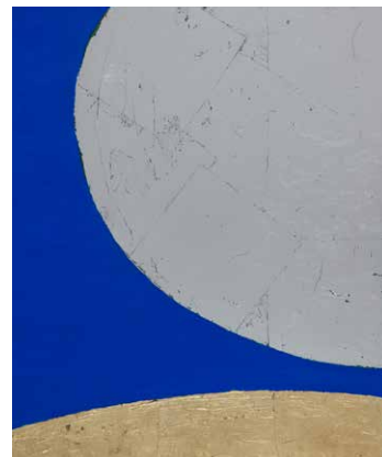
Anna- Eva Bergman, Sense títol , 1970.

Anna-Eva Bergman (1909-1987) és una artista noruega que considera essencial el «ritme» com a element estructural de la pintura, un ritme fruit de l'ús de determinades matèries –com ara l'ús per addició de fulles de metall, pa d'or, plata o coure–, formes, línies i colors. La seua producció experimenta un gir radical a partir dels anys cinquanta, quan se centra en l'abstracció pictòrica. Hi ha en l'obra un vincle entre Noruega i Espanya –nord i sud– que desemboca en una formalitat semblant entre tots dos paisatges. Christine Lamothe i Nuria Enguita comisariarien la mostra.