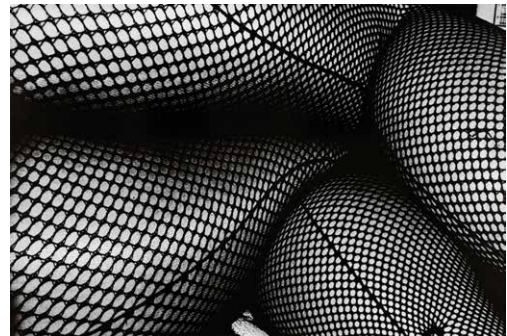
Daido Moriyama, Tights , 2016.

En l'exposició Nous llenguatges visuals al Japó des de 1950 veurem les obres d'un nombre destacat d'artistes que van utilitzar les imatges de manera experimental en un context marcat per uns esdeveniments polítics importants. A partir d'un recorregut personalitzat segons el nivell educatiu, proposarem experimentar amb les imatges que ens envolten i diferents formats físics i virtuals.