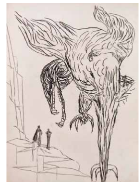
Nicolás Ortigosa. Infierno . De la sèrie Divina Comedia , 2009.

L'exposició presenta Divina Comedia , huitanta-nou peces -dibuixos i gravats- que l'artista de Logronyo crea a partir del poema de Dante. Entre els anys 2005 i 2014, concep les tres sèries - Infierno , Purgatorio i Paraíso - com un impuls creatiu que naix a partir de la lectura, i s'allunya d'una voluntat il·lustrativa. L'obra, que pertany a la col·lecció Per Amor a l'Art, està acompanyada del treball més recent de Nicolás Ortigosa.