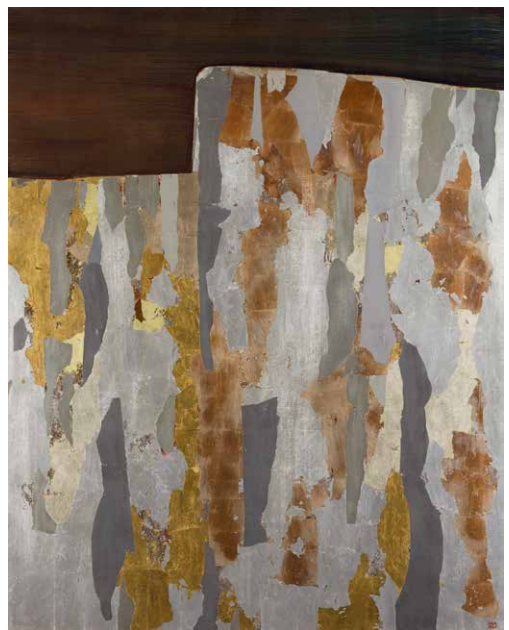
Anna- Eva Bergman, N°30 - 1965 Falaise , 1965.

La matèria i la memòria, portadores de forma i significat, seran els ingredients sobre els quals treballarem.